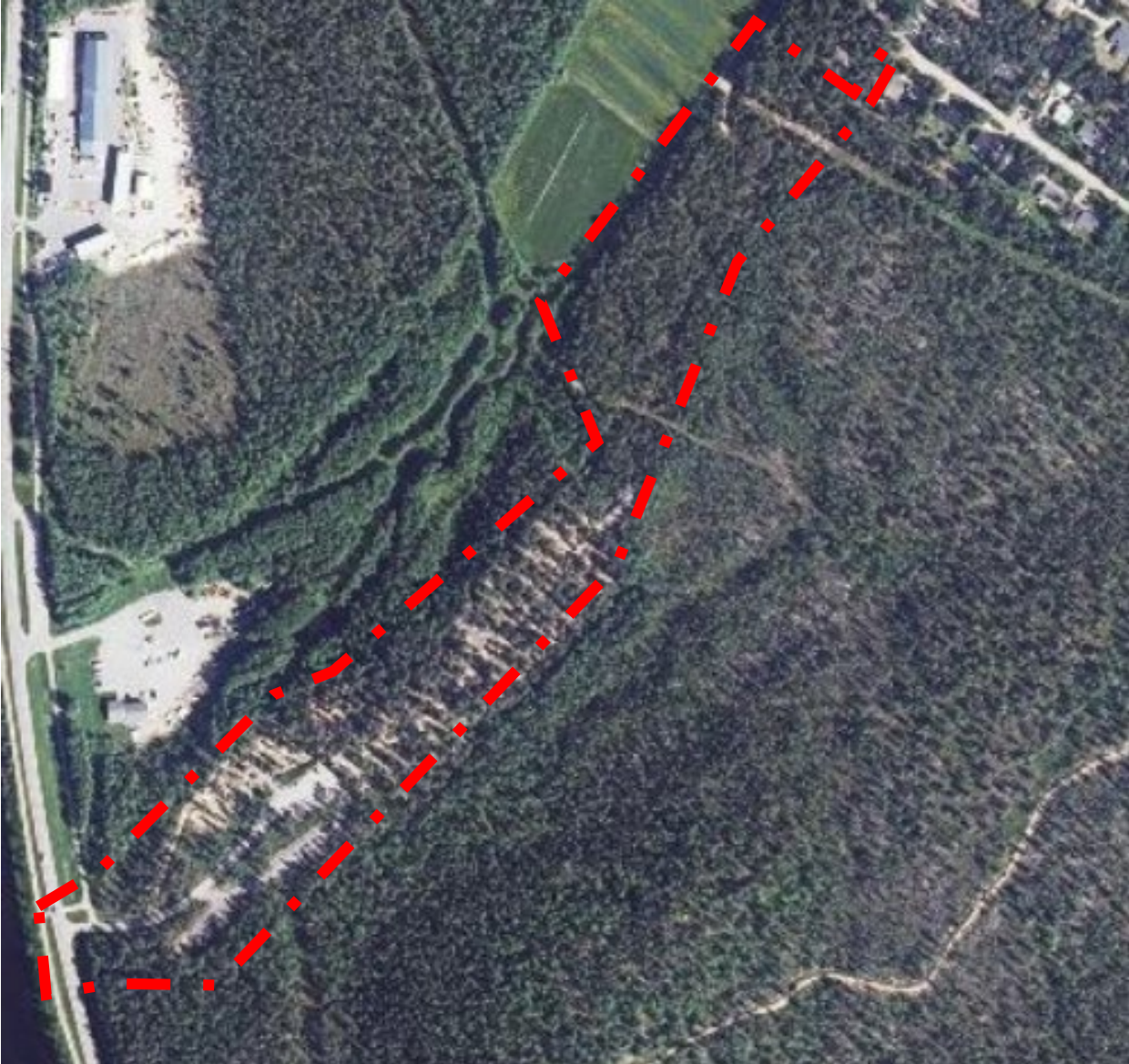
Kuva 2 Ilmakuva alueesta